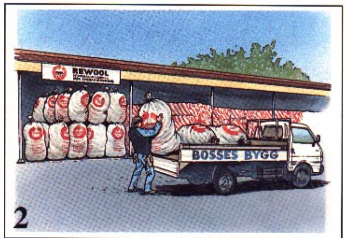
2 Säckarna lämnas hos någon av de Rockwoolåterförsäljare som medverkar i REWOOL-konceptet. Säckarna lagras väderskyddade. När tillräcklig mängd säckar samlats kontaktas lösullsentreprenören.