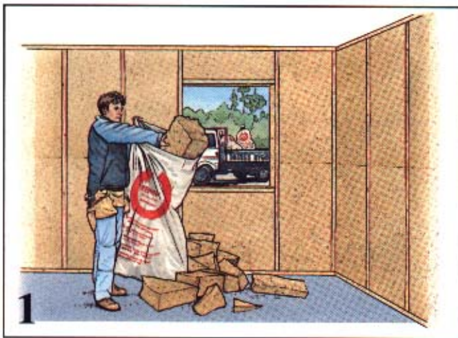
1 Överbliven isolering samlas ihop på byggarbetsplatsen i återvinnings säckarna.

Till vårt produktsortiment har vi nu lagt ett erbjudande om att ta hand om stenullsspill. Våra återförsäljare marknadsför detta erbjudande. De säljer säckar till byggarna (Säck för stenullsspill 8403-00) och tar emot fyllda säckar.